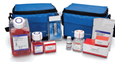
Наборы для клонирования