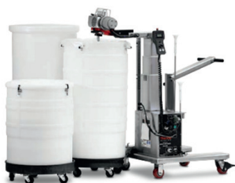
HyPerforma DS 300

imPULSE : с инновационной технологией перемешивающих дисков, для мешков до 5000 л.