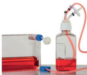
Для перистальтич. насосов