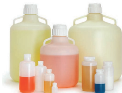
Банки, флаги, конистры

Суперчистые валидированные емкости для хранения и транспортировки различных растворов, сред, готовых продуктов небольшого объема; пластиковые бочки и контейнеры, стальные контейнеры с рубашкой для работы с объемами до 3000 л.