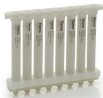
Колонки для скрининга

Сорбенты для аффинной, ионообменной и гидрофобной хроматографии Poros и CaptureSelect , для разделения белков, вирусных векторов, антител и т.д.