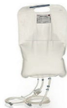
Вода для инъекций