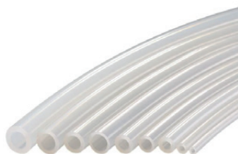
С платиновым напылением

Силиконовые трубки с платиновым напылением, гибкие, прочные, для перистальтических насосов; предотвращают абсорбцию белков и пищевых продуктов, благодаря поверхности с низким уровнем связывания; идеальны в фармацевтике и пищевой промышленности.