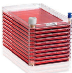
Nunc Cell Factory

Система Nunc Cell Factory упрощает наполнение и создает замкнутую среду, а воздушные фильтры облегчают вентиляцию. Под систему разработаны инкубаторы и манипуляторы. Так же представлены классические роллерные бутылки и сосуды для культивирования Nunc .