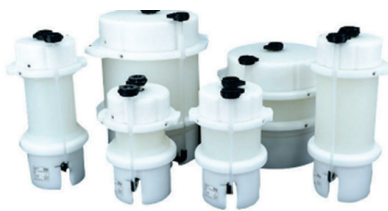
Препаративные готовые колонны