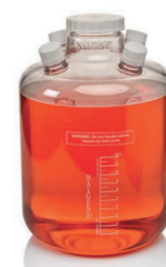
Сосуд для культив.